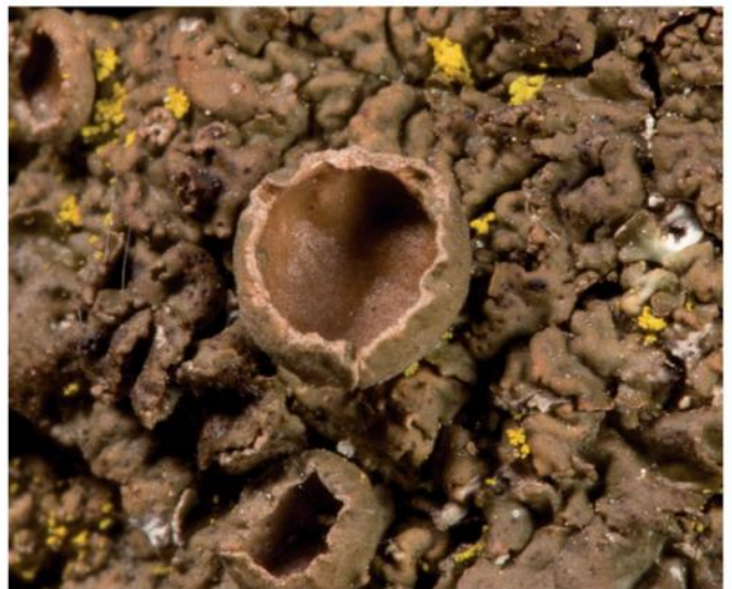
Imágenes: Sergio Pérez-Ortega