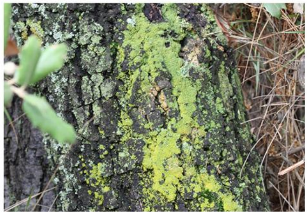
Imatges: Antonio Gómez Bolea